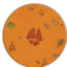
Круглый жетон с символом копыта