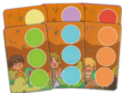
6 карточек дорожек 6 разных цветов