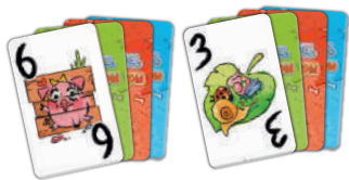
84 карточки приманки (6 наборов с обложками разных цветов по 14 карточек)